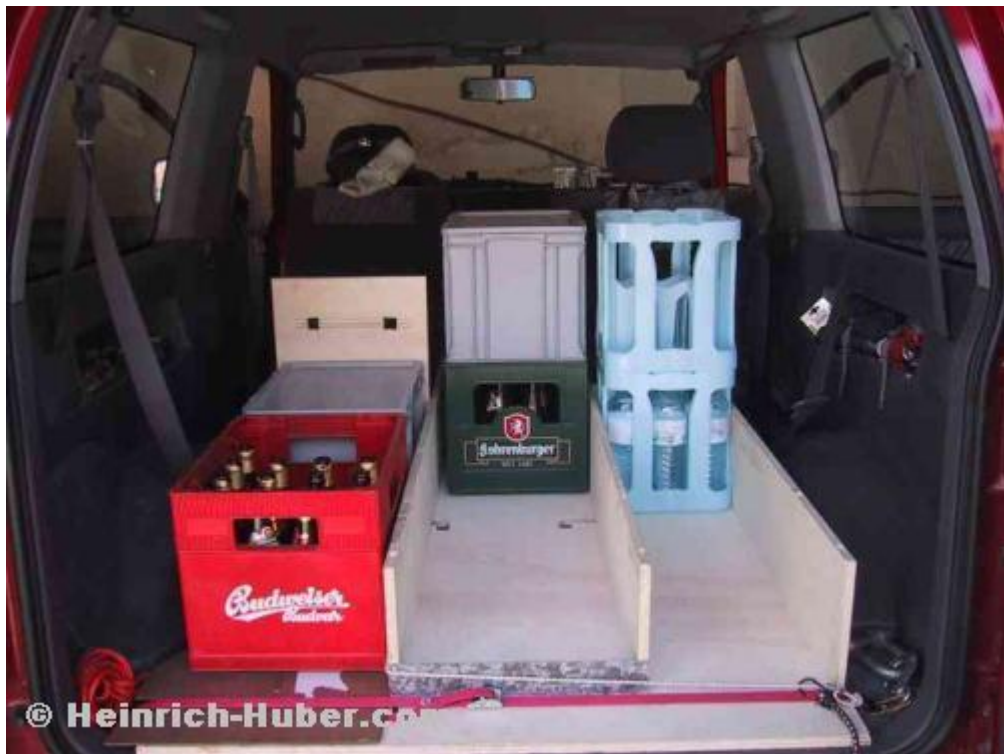
Beladung im 'Normalbetrieb'. Liege-Brett und hinteres Fix-Brett wird entfernt